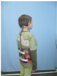
Gorset Milwaukee - widok z tyłu

Gorsety Milwaukee możemy wykonać z własnych elementów lub z elementów importowanych.