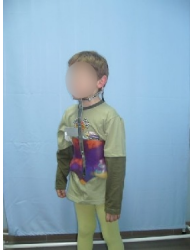
Gorset Milwaukee - widok z przodu

Gorset ten stosujemy od kilkadziesiąt lat. W okresie tym wspólnie z Kliniką Rehabilitacji Akademii Medycznej w Poznaniu modernizowaliśmy jego konstrukcję w celu otrzymania optymalnego rozwiązania pozwalającego na maksymalną korektę i kompensatę skrzywienia kręgosłupa.